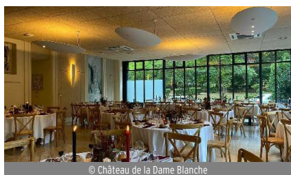
© Château de la Dame Blanche