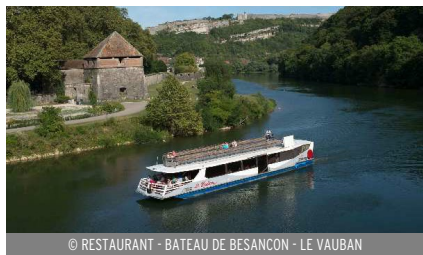
© RESTAURANT - BATEAU DE BESANCON - LE VAUBAN