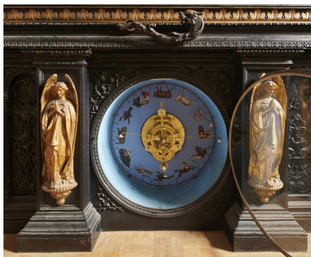
Cadran central du système solaire, soubassement