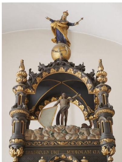
Ornement sommital, Le Christ Ressuscité et l'Immaculé Conception