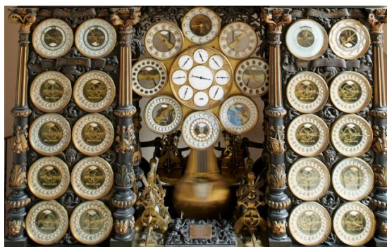
Corps central